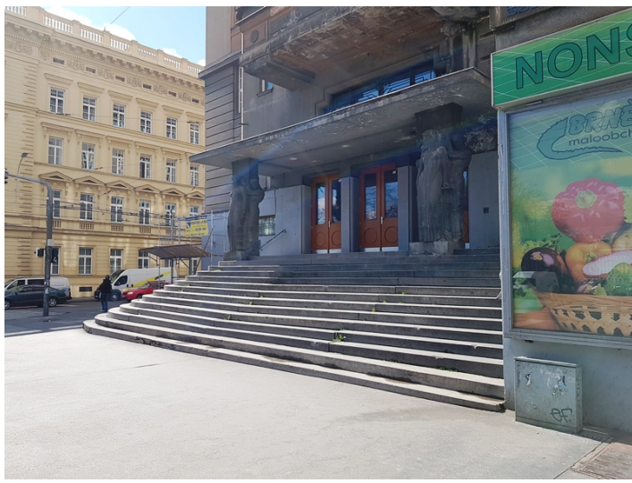
Detail vstupního monumentálního schodiště na ulici Kounicova