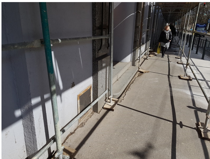
Detail spodních částí fasády v ulici Žerotínovo Náměstí