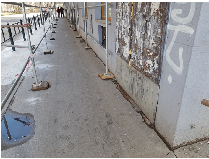
Detail spodních částí fasády v ulici Žerotínovo Náměstí