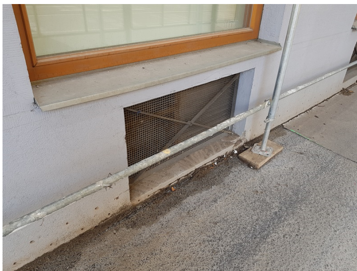
Pohled na spodní partii fasády s neutěsněným detailům styku obvodové stěny a chodníku v blízkosti výdechového otvoru vzduchové šachty