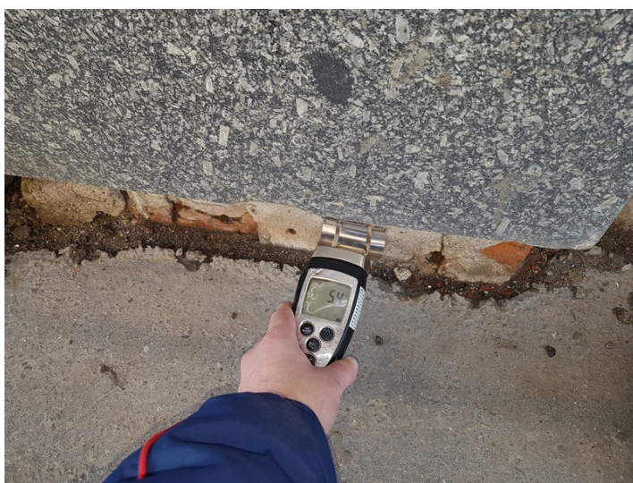
Detail měření vlhkosti zdiva ve spodní partii fasády s naměřenou hodnotou 5.4%