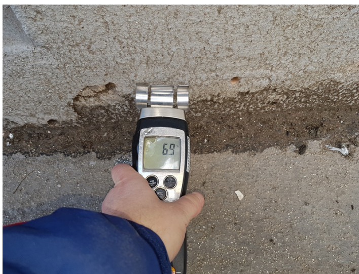
Detail měření vlhkosti zdiva ve spodní partii fasády s naměřenou hodnotou 6.9%